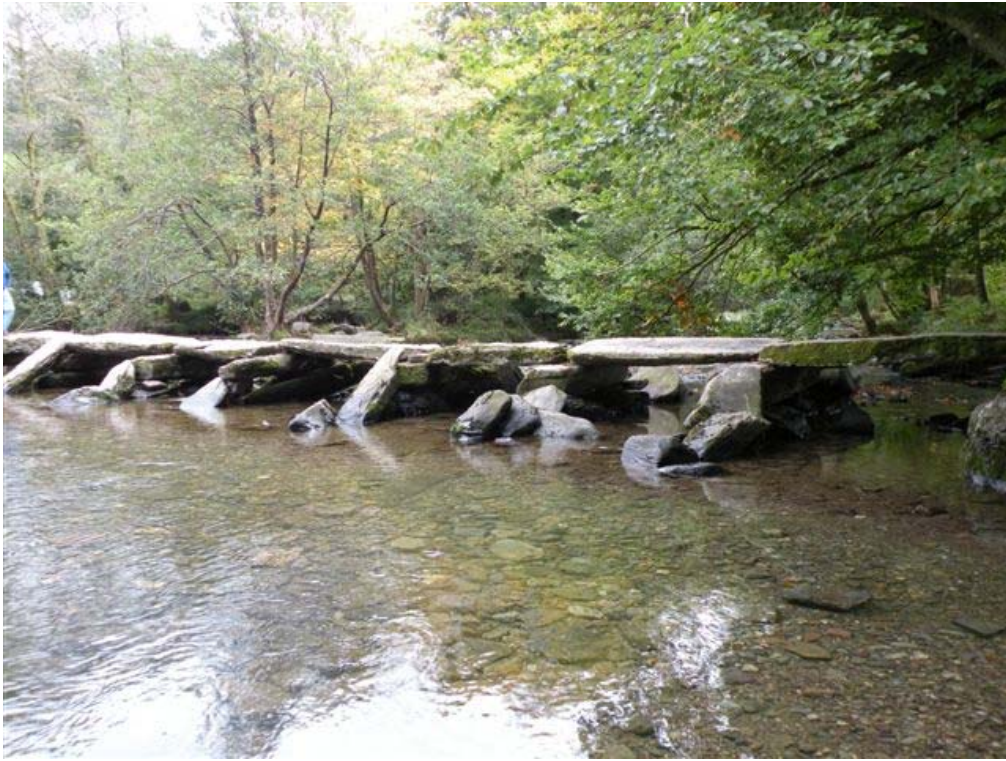
גשר אבן עתיק