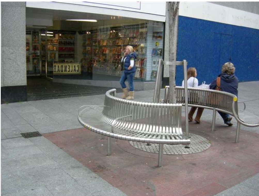
במרכז העיר EXETER ספסלים בעיצוב חדשני מקומות הישיבה חלקם עם וחלקם ללא משענת יד