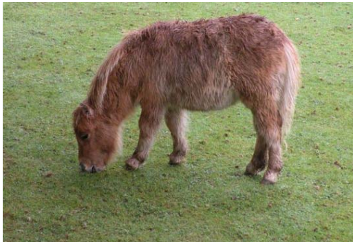
חיות סוסי פוני