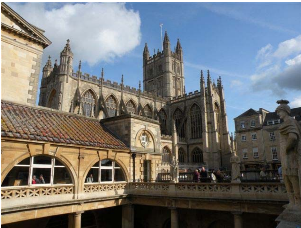
מבט על העיר באת' (BATH) והקתדרלה מהמרחצאות הרומיים