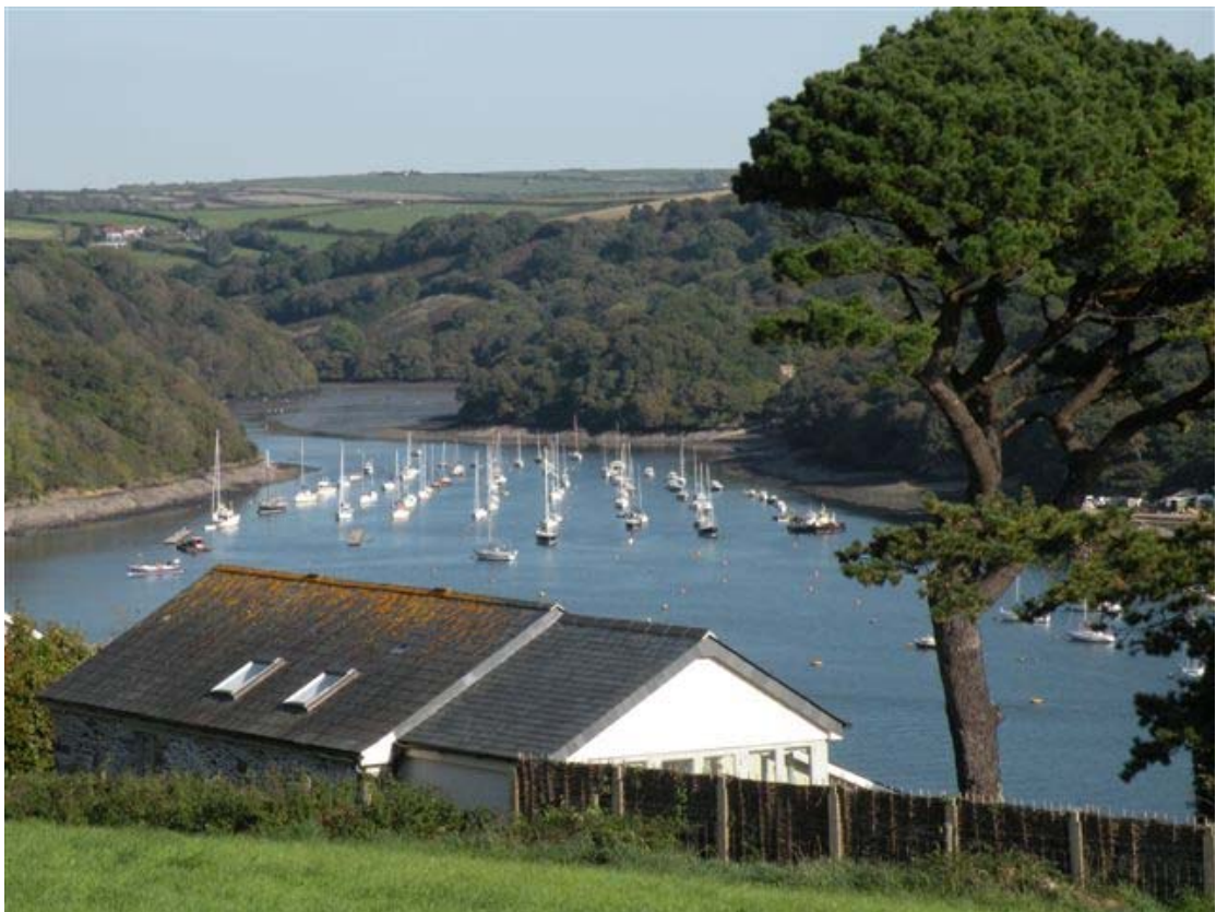
* תודה לבן זוגי יעקב עילם שצילם את רוב התמונות.