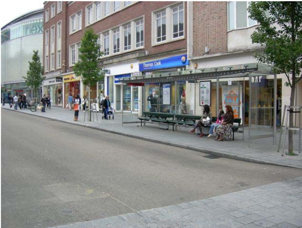
הרחוב הראשי במרכז העיר EXETER (להולכי רגל ולתחבורה ציבורית בלבד)