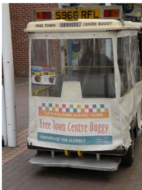
הסעות חינם במרכז העיר ווקינג (WOKING) (מדרום ללונדון)