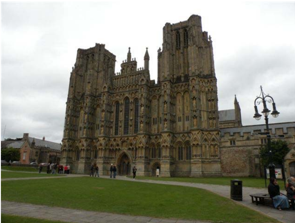
הקתדרלה בעיר WELLS . יש נגישות. – נגישות בחוץ