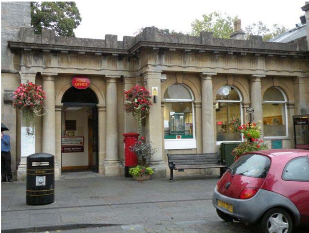
נגישות בכיכר השוק המובילה לקתדרלה בעיר WELLS