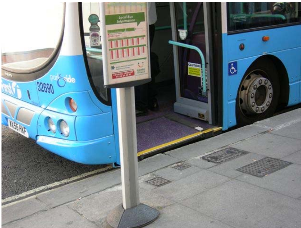
גובה משטח התחנה זהה למפלס הכניסה לאוטובוס. (שימו לב: בתמונה המיקום של מכסי הביוב בתחנה קצת מפריע לנוחות ההולכים).

הנוסעים נכנסים לאוטובוס שרצפתו במפלס המדרכה בתחנה ללא מדרגה. הנהג צריך להוריד את הרמפה רק באותם מצבים בהם נוסע מתקשה להתגבר על המרווח שנותר בין האוטובוס ובין המדרכה כגון: נוסע/ת המשתמש ברולטור, בכיסא גלגלים או בקלנועית, נוסע/ת המגיע עם עגלת קניות או עם עגלת תינוק. הרמפה הפתוחה מתגברת על המרווח בין רצפת האוטובוס לבין המדרכה ללא שיפוע או בשיפוע כמעט בלתי מורגש.