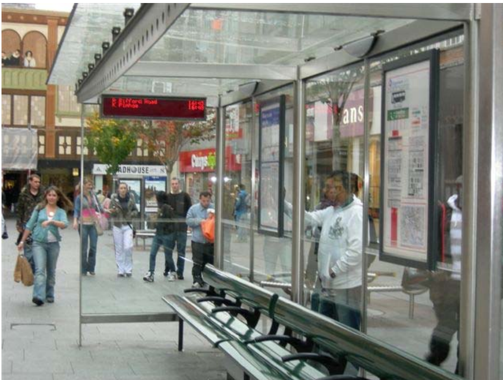
בתוך התחנה שילוט אלקטרוני מתחלף. מיקום השילוט: גבוה מדי. הצבעים: אדום על שחור. הגודל: קטן מדי.