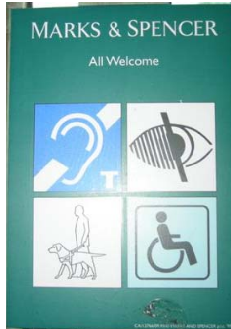
דוגמאות לשילוט מזמין ללקוחות עם מוגבלות