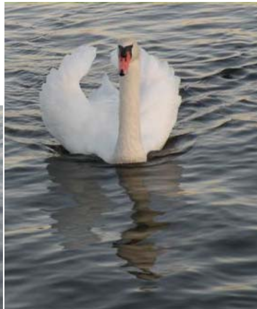
ברבורים וברווזים שטים להם בנחת באגמים