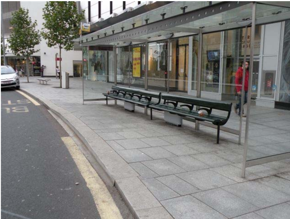
תחנת אוטובוס נגישה במרכז העיר EXETER