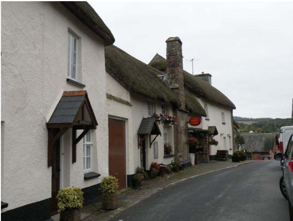
בתים עם גגות קש במחוז דבון (DEVON)