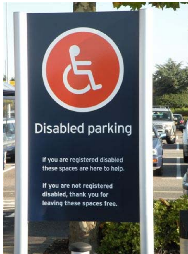
דוגמה לשילוט חניית נכים במרכז קניות

בחניות של מרכולים ומרכזי הקניות מסומנים בדרך כלל הרבה מקומות חניה לנכים וכן מקומות חניה להורים עם ילדים.